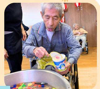
スーパースボールすくい